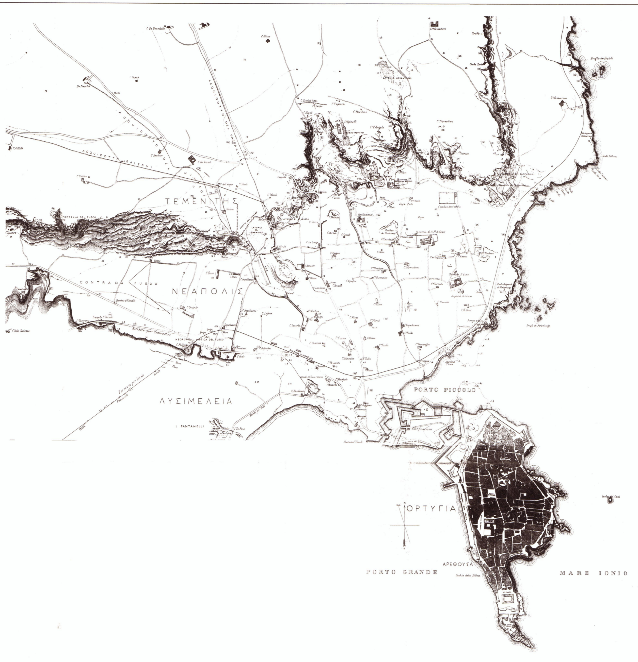
TOPOGRAFIA ARCHEOLOGICA di SIRACUSA ORDINATA DAL MINISTERO DELLA PUBBLICA ISTRUZIONE ESEGUITA NEL 1881 dal ING. FRANCESCO SAVERIO CAVALLARI coll. l'ING. CRISTOFORO CAVALLARI PROPORZIONE 1:10000