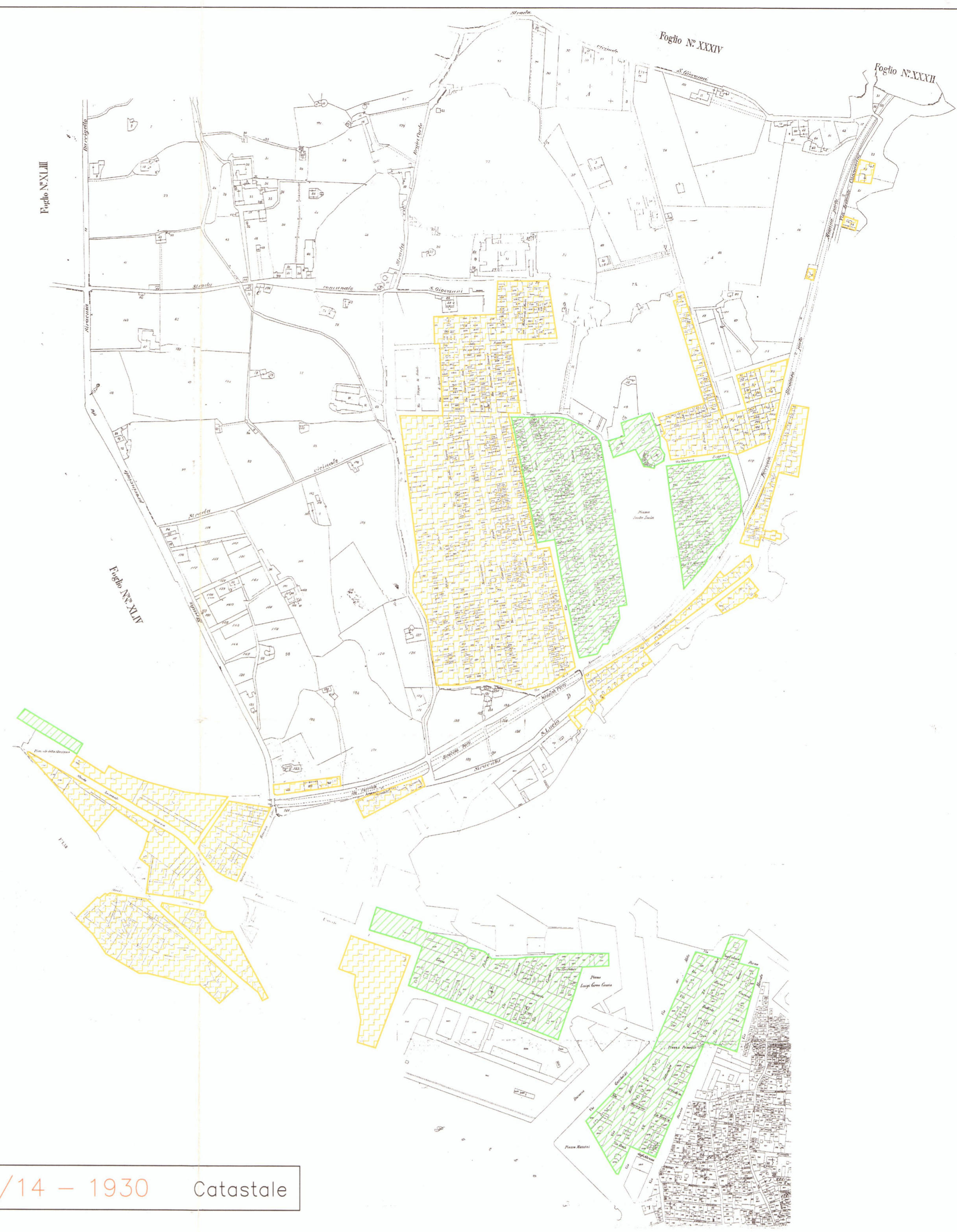
1913/14 - 1930 Catastale