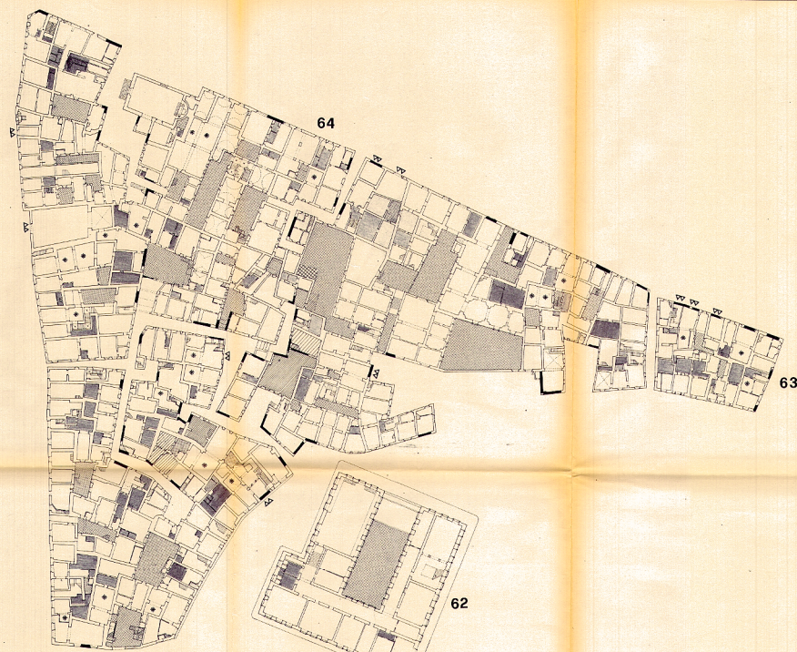
PIANO TERRA 65